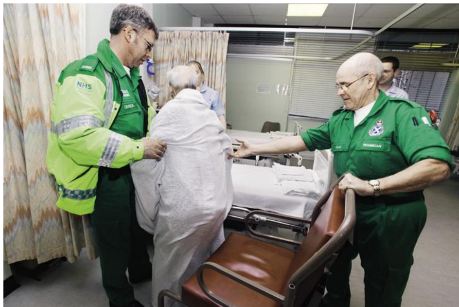
Innerhalb der europäischen Gesundheitssysteme kann grob zwischen steuerbasierten Systemen und Systemen mit gesetzlicher Krankenversicherung unterschieden werden. Beide Typen haben sich in den letzten Jahrzehnten stark weiterentwickelt und differenziert.

In Europa lassen sich im Wesentlichen zwei Modelle von Gesundheitssystemen unterscheiden: Das Beveridge-Modell, das sich in der Finanzierung primär auf Steuern stützt, ist in den nordeuropäischen Ländern sowie in Irland und dem Vereinigten Königreich anzutreffen. Auch südeuropäische Länder wie Spanien, Portugal und Griechenland sind seit den Achtzigerjahren eher dieser Gruppe zuzurechnen. Das Bismarck-Modell mit der gesetzlichen Krankenversicherung (GKV) ist hingegen in fast allen mitteleuropäischen und seit etwa zehn Jahren auch in nahezu allen osteuropäischen Ländern verbreitet.