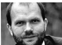
Pr Reinhard Busse Section Gestion de la santé, Institut des sciences de la santé, université technique de Berlin

Une autre question primordiale est celle de l'allocation ou de la réallocation aux agents payeurs, donc de la compensation des risques. Les questions de compensation (structurelle) des risques se posent aussi dans les systèmes qui ne sont pas axés sur la compétitivité lorsqu'il s'agit de savoir comment le fonds national doit être réparti entre les régions: le montant adéquat du financement doit-il être fixé antérieurement ou postérieurement? à côté des variables démographiques générales (comme l'âge et le sexe), faut-il aussi tenir compte d'indicateurs de morbidité des personnes? Les agents payeurs achètent des prestations par voie contractuelle et rétribuent les fournisseurs de prestations. Pour le système de santé, d'autres questions tout à fait essentielles