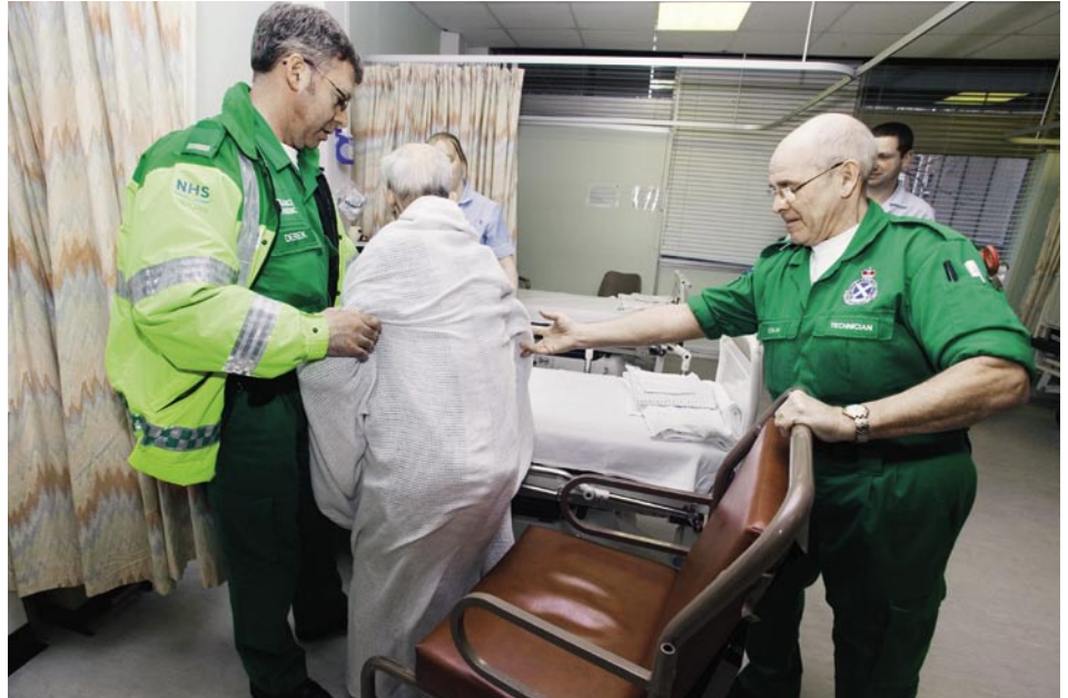
Les systèmes de santé européens peuvent globalement se subdiviser en deux catégories: ceux financés par l'impôt et l'assurance-maladie obligatoire. L'un et l'autre ont beaucoup évolué, tout en se différenciant, ces dernières décennies.

L'Europe connaît essentiellement deux types de systèmes de santé. Le modèle de Beveridge, financé surtout par l'impôt, se retrouve dans les pays nordiques, l'Irlande et le Royaume-Uni, encore que depuis les années quatre-vingt, on tend aussi à lui rattacher des pays du sud comme l'Espagne, le Portugal et la Grèce. Le système mis en place par Bismarck (ou bismarckien) est celui de l'assurance-maladie obligatoire (AMO); il est répandu dans la quasi-totalité des pays d'Europe centrale et, depuis une dizaine d'années, en Europe orientale.